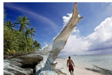
L'une des îles de l'archipel de Tuvalu en février 2004.