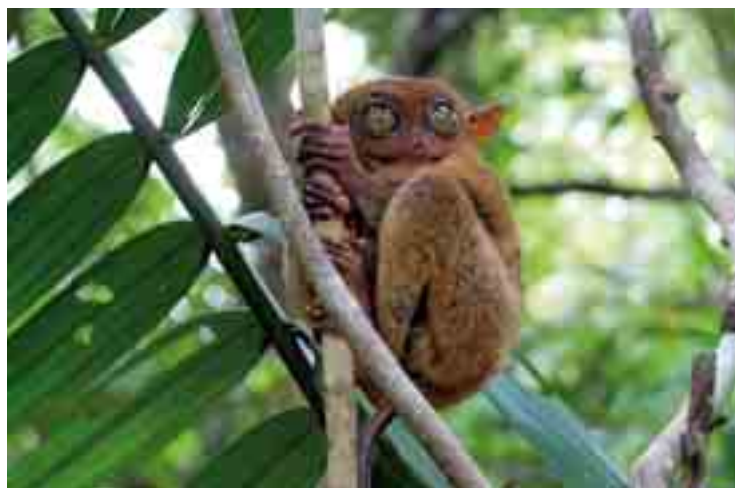
Le tarsier des Philippines a des oreilles de chauve-souris, d'immenses yeux et une longue queue.

Aux Philippines, des touristes viennent prendre en photo des tarsiers ou essayer de les toucher. Ils ne savent pas que cela les met en danger. À cause d'eux, les primates stressent et se tapent la tête contre les arbres. Parfois, ils se suicident en arrêtant de respirer ! Les tarsiers sont en danger, menacés par la destruction de leur habitat. Depuis 1997, les Philippines essaient de les protéger.