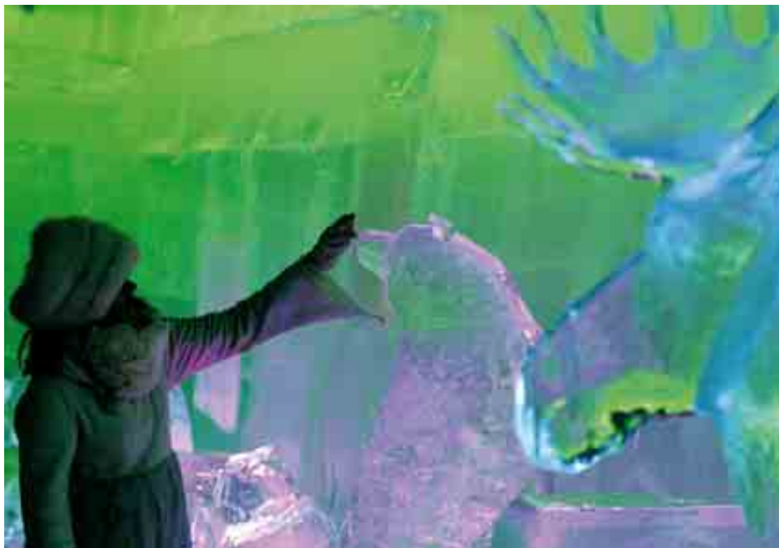
LA PHOTO DU JOUR Une jeune femme marche parmi des sculptures en glace, à Rovaniemi, en Finlande (Europe). La ville est appelée « le pays du Père Noël ».

Primate : mammifère qui a le cerveau développé et peut saisir des objets avec ses mains.